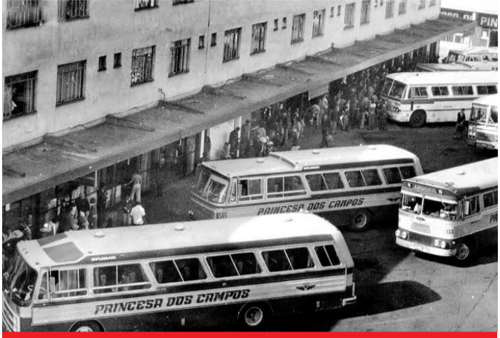
Rodoviária antiga de Cascavel, década de 1970. INAUGURADA APENAS UMA VEZ!